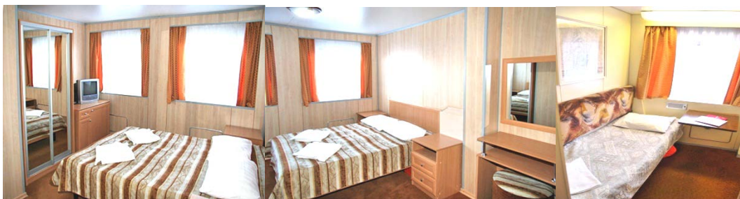
1-местная каюта (средняя, шлюпочная палубы)